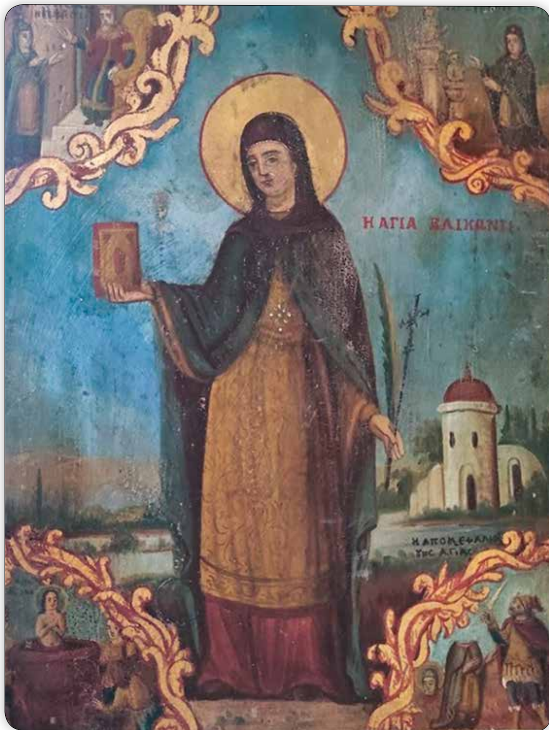
Ἱερά Εἰκόνα τῆς Ἀγίας Ἐλικωνίδος, μετά σκηνῶν τοῦ βίου της, εὔρισκομένη εἰς τόν Ἐνοριακόν Ναόν Ἀγίου Δημητρίου Σύμης.