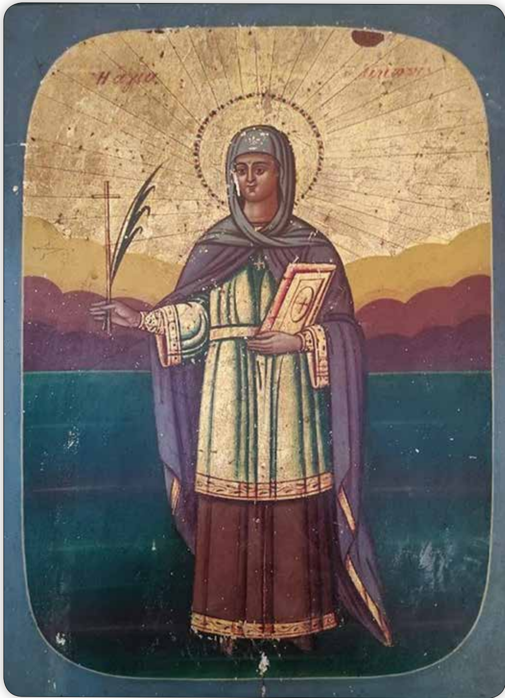
Ἱερά Εἰκόνα τῆς Ἁγίας Ἑλικωνίδος, εὑρισκομένη εἰς τόν ὁμώνυμον Κοιμητηριακόν Ναόν «Παλαμιδᾶ» Σύμης.