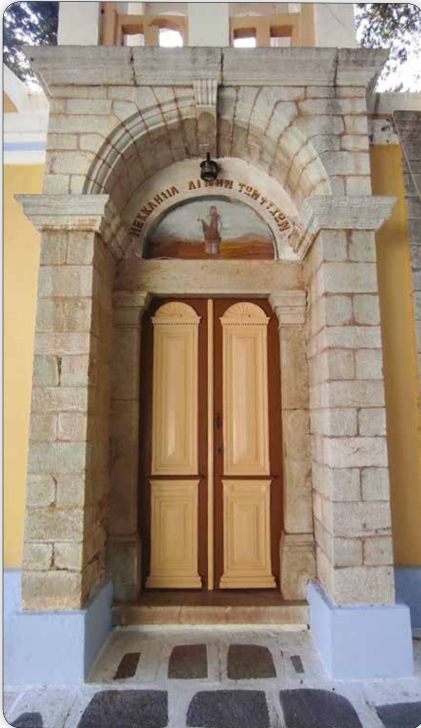
Ἡ κυρία εἴσοδος τοῦ Ἱ. Κομητηριακοῦ Ναοῦ τῆς Ἁγίας Ἐλικωνίδος «Παλαμιδᾶ» Σύμης.