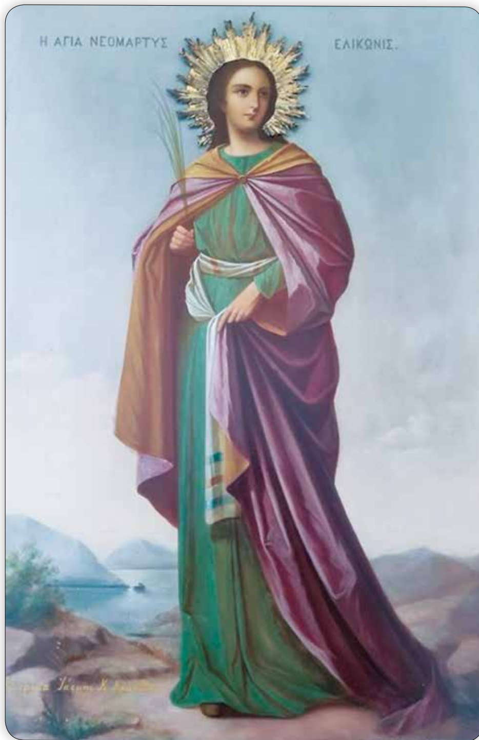
Ἱερά Εἰκόνα τῆς Ἁγίας Ἐλικωνίδος, Ἀναγεννησιακῆς τεχνοτροπίας, εὑρισκομένη εἰς τόν ὁμώνυμον Κοιμητηριακόν Ναόν «Παλαμιδά» Σύμης.