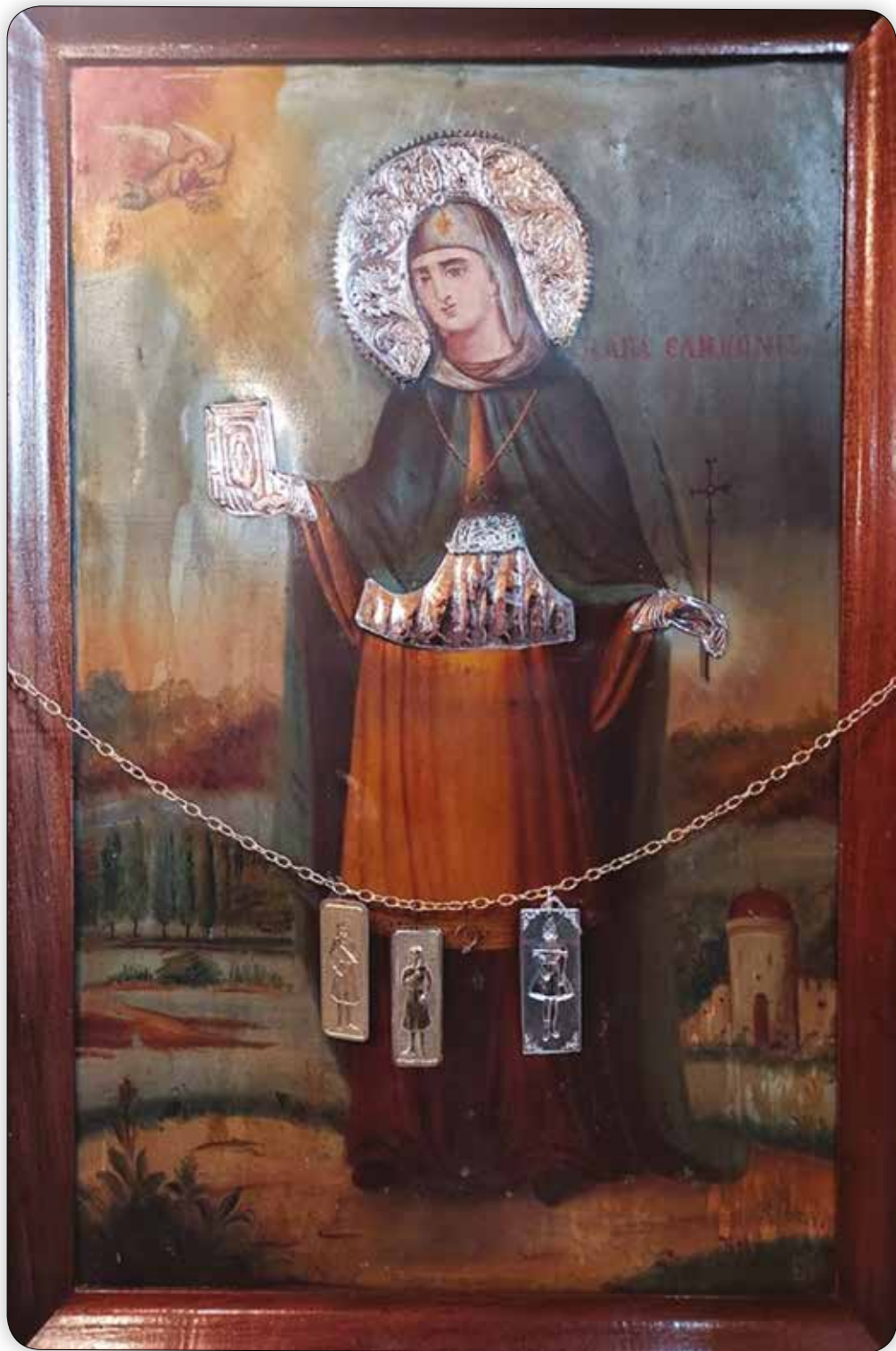
Ἱερά Εἰκόνα τῆς Ἀγίας Ἐλικωνίδος, μετ' ἀργυροῦ φωτιστεφάνου, εὕρισκομένη εἰς τόν Ἐνοριακόν Ναόν Ἁγίου Δημητρίου Σύμης.