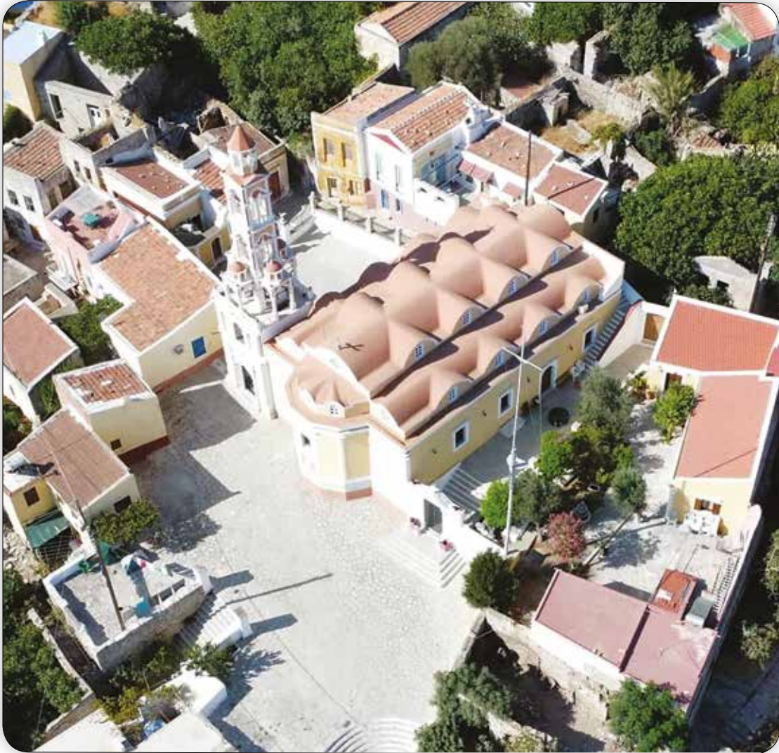
Άεροφωτογραφία τοῦ κτιριακοῦ συγκροτήματος τοῦ Ἐνοριακοῦ Ἱ. Ναοῦ τοῦ Ἁγίου Ἀθανασίου Σύμης.