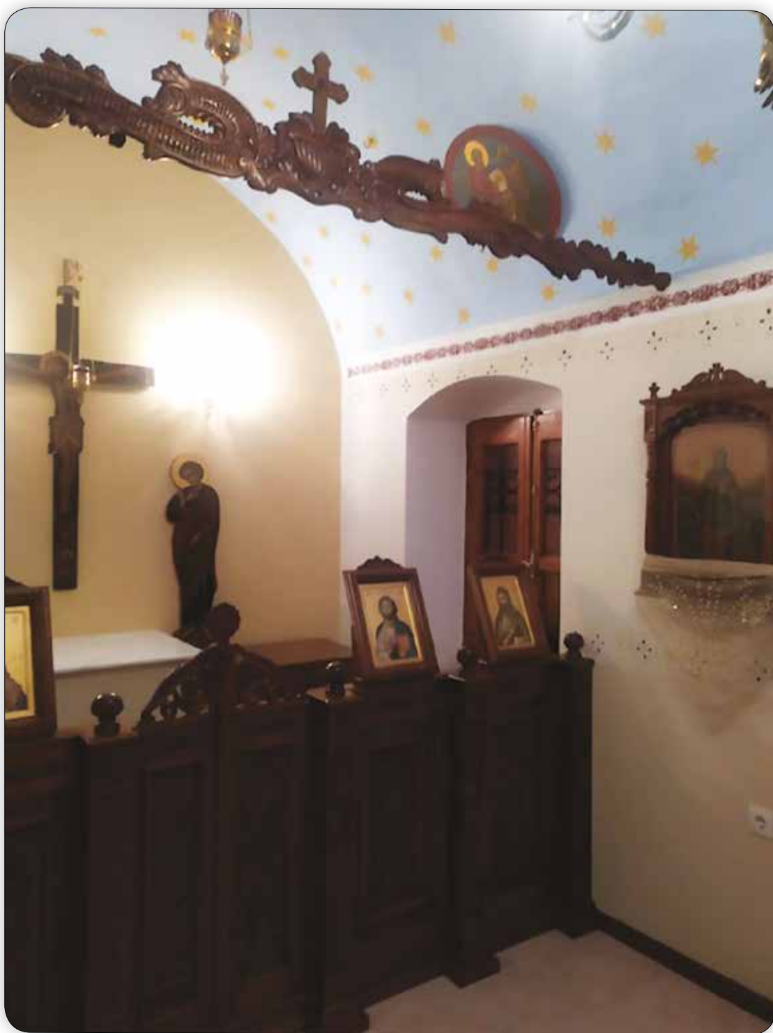
Ἐσωτερικὴ ἄποψις τοῦ Ἱ. Παρεκκλησίου Ὁσίου Σάββα τοῦ ἐν Καλύμνῳ, τοῦ Ἐνοριακοῦ Ναοῦ τοῦ Ἁγίου Ἀθανασίου Σύμης, ἔνθα φυλάσσεται ἡ Ἱερά Εἰκόνα τῆς Ἁγίας Ἐλικωνίδος.