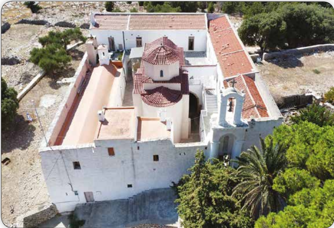
Ἀεροφωτογραφία τοῦ κτιριακοῦ συγκροτήματος τῆς Ἱερᾶς Μονῆς Ταξιάρχου Μιχαήλ τοῦ Ρουκουनिώτου Σύμης.