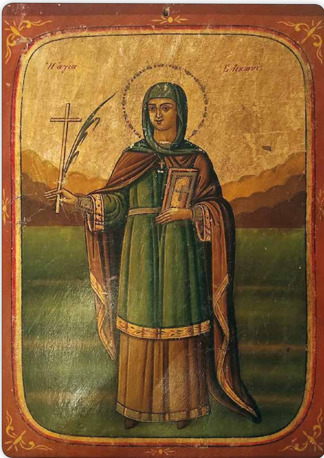
Ἡ πρώτη ἐν Σύμῃ Ἱερά Εἰκόνα τῆς Ἁγίας Ἐλικωνίδος, εὑρισκομένη εἰς τόν Ἐνοριακόν Ναόν τοῦ Ἁγίου Ἀθανασίου Σύμης.