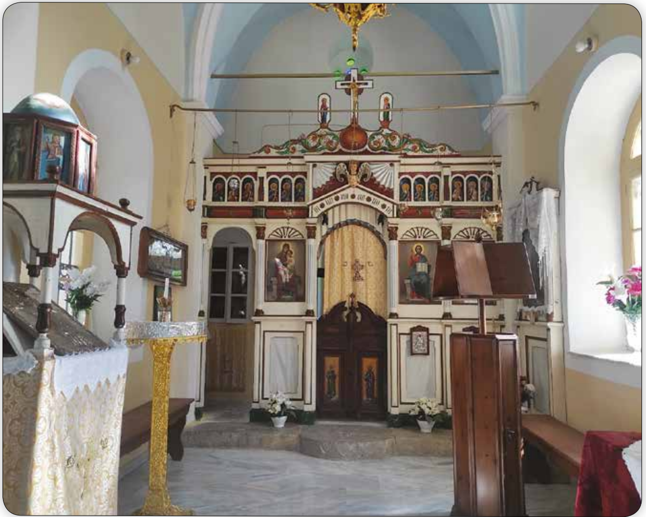
Ἐσωτερικὴ ἄποψις τοῦ Ἱ. Κοιμητηριακοῦ Ναοῦ τῆς Ἁγίας Ἐλικωνίδος Σύμης, ἔνθα φυλάσσονται αἱ Ἱεραὶ Εἰκόνες τῆς Ἁγίας.