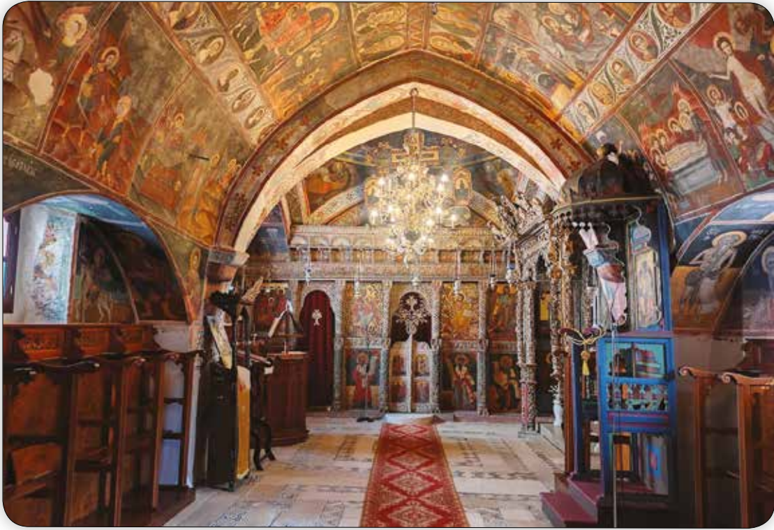
Ἐσωτερική ἄποψις τοῦ Καθολικοῦ τῆς Ἱερᾶς Μονῆς Ταξιάρχου Μιχαήλ τοῦ Ρουκουनिώτου Σύμης, ἔνθα φυλάσσεται ἡ Ἱερά Εἰκόνα τῶν Ἁγίων.