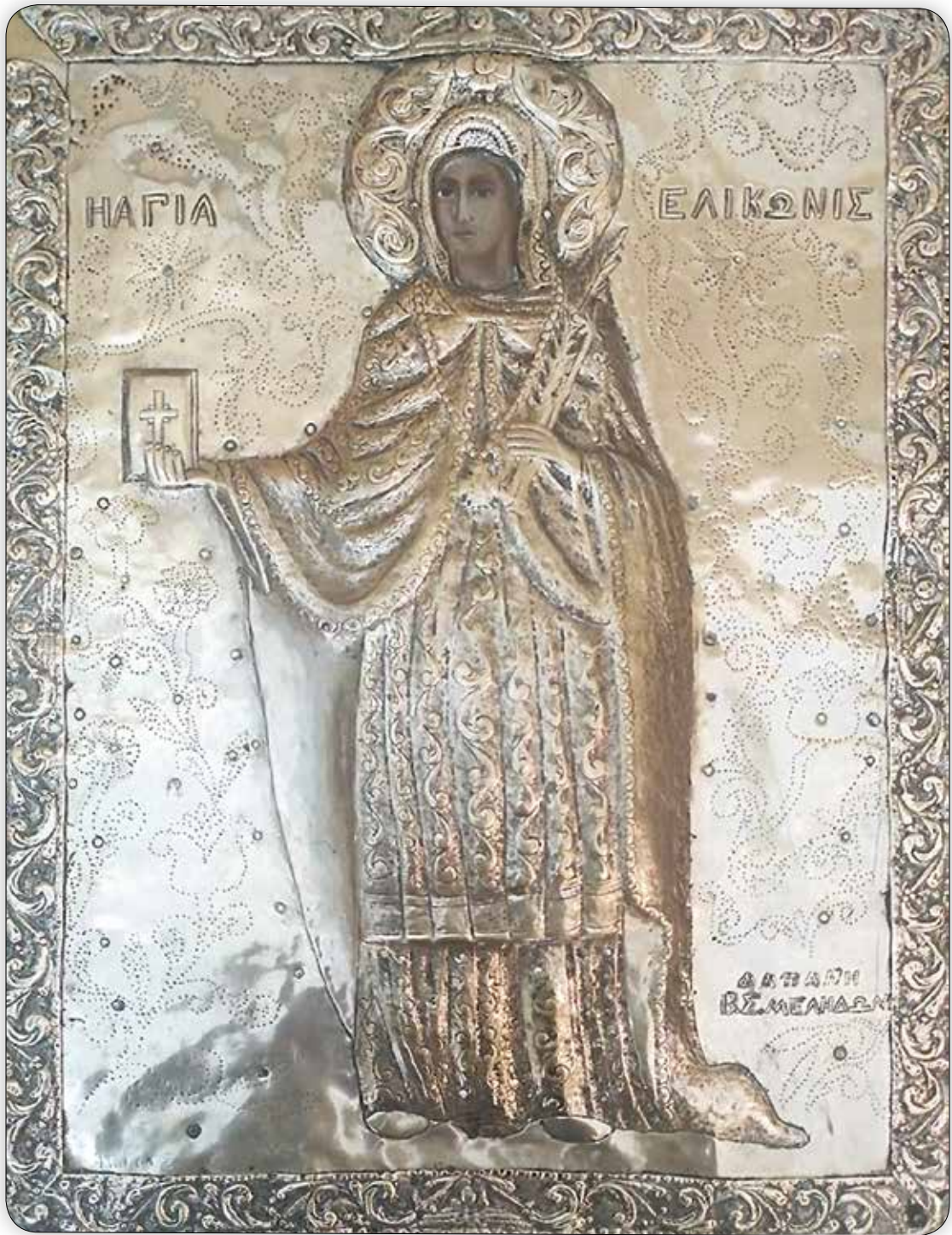
Ἱερά Εἰκόνα τῆς Ἁγίας Ἐλικωνίδος, μετὰ ἀργυρᾶς ἐπενδύσεως, εὑρισκομένη εἰς τόν ὁμώνυμον Κοιμητηριακόν Ναόν «Παλαμιδᾶ» Σύμης.