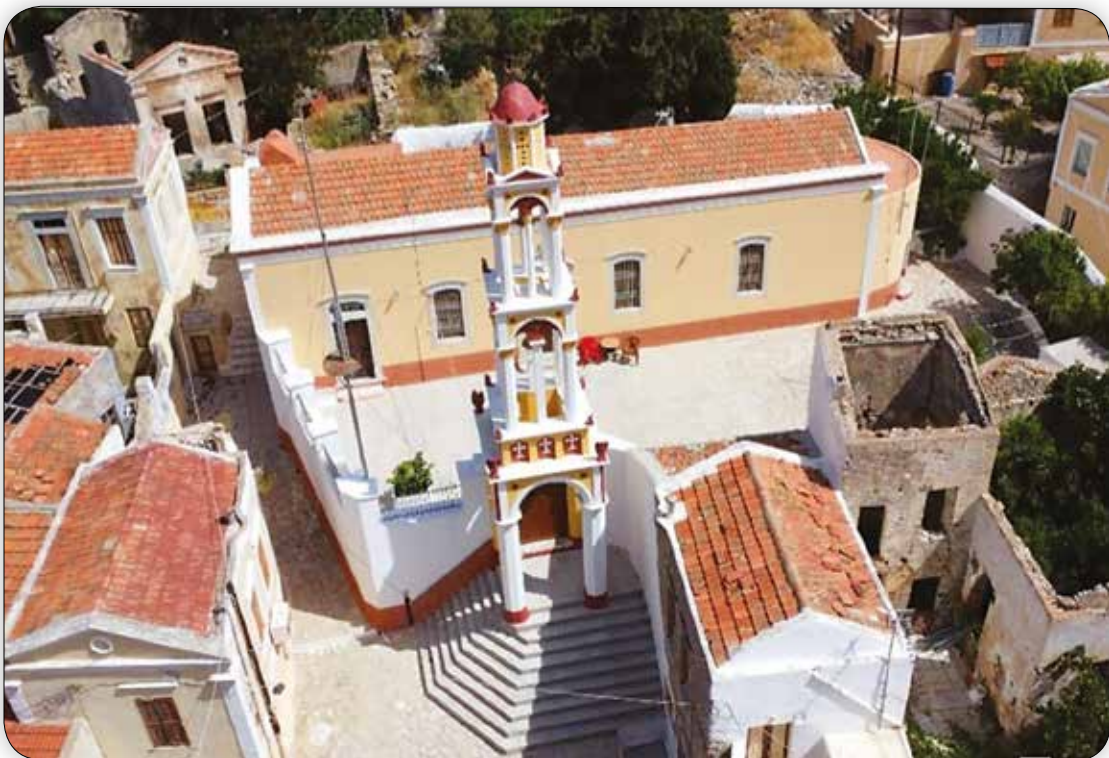
Ἀεροφωτογραφία τοῦ κτιριακοῦ συγκροτήματος τοῦ Ἐνοριακοῦ Ἱ. Ναοῦ Ἁγίου Δημητρίου Σύμης.