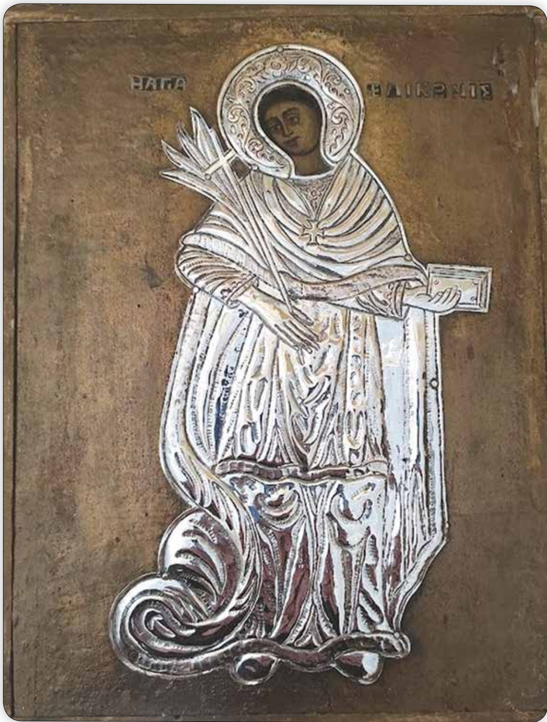
Ἱερά Εἰκόνα τῆς Ἁγίας Ἐλικωνίδος, μετὰ ἀργυρᾶς ἐπικαλύψεως, εὑρισκομένη εἰς τόν ὁμώνυμον Κοιμητηριακόν Ναόν «Παλαμιδᾶ» Σύμης.