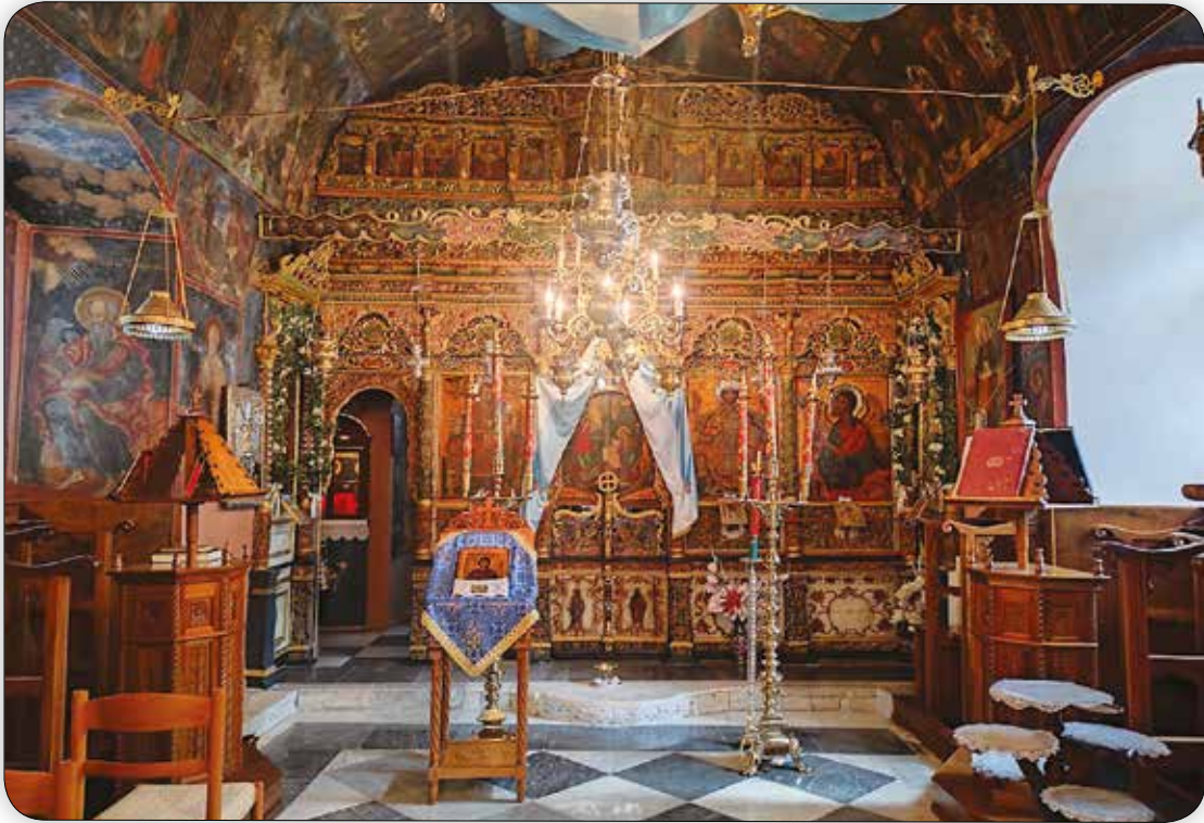
Ἐσωτερική ἄποψις τοῦ Ἐνοριακοῦ Ναοῦ Ἁγίου Δημητρίου Σύμης, ἔνθα φυλάσσονται αἱ Ἱεραὶ Εἰκόνες τῆς Ἁγίας.