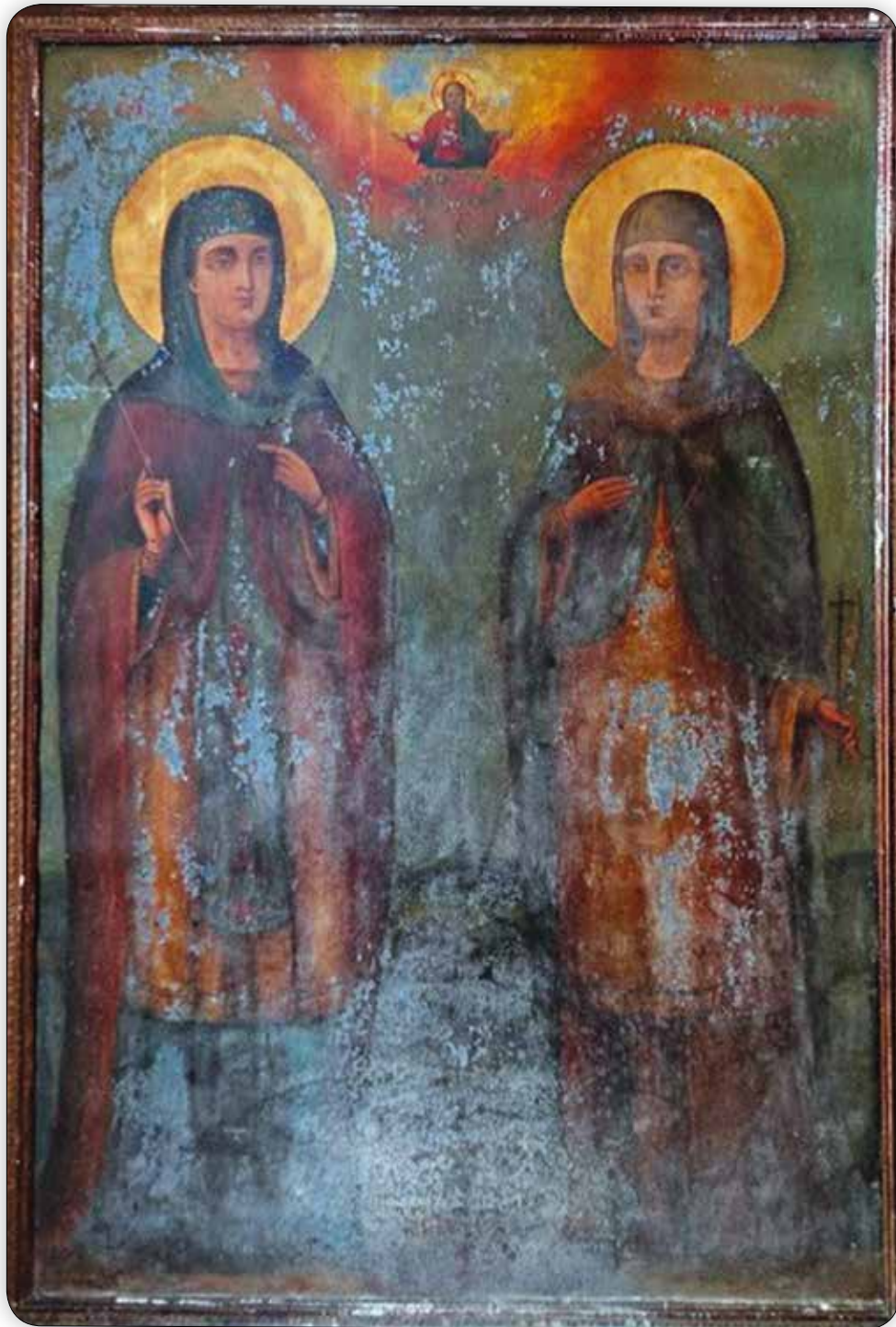
Ἱερά Εἰκόνα τῶν Ἁγίων Ἐλικωνίδος (δεξιά) καί Ὁραιοζήλης, εὑρισκομένη εἰς τήν Ἱερά Μονή Ταξιάρχου Μιχαήλ τοῦ Ρουκουνώτου Σύμης.