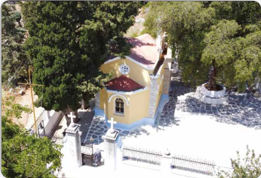
Ἀεροφωτογραφία τοῦ Ἱ. Κοιμητηριακοῦ Ναοῦ τῆς Ἁγίας Ἐλικωνίδος «Παλαμιδᾶ» Σύμης.